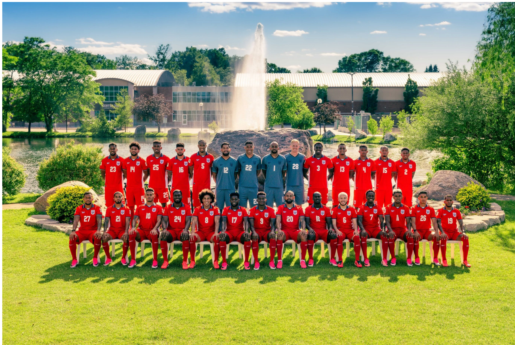
Selección de Panamá clasificada al Mundial 2026.

La nota de Flores surge previo al encuentro entre las selecciones de Panamá y Ghana, que se desarrolló el miércoles 17 de junio en el Toronto Stadium, en el primer compromiso del Grupo L de la Copa Mundial de la FIFA 2026.