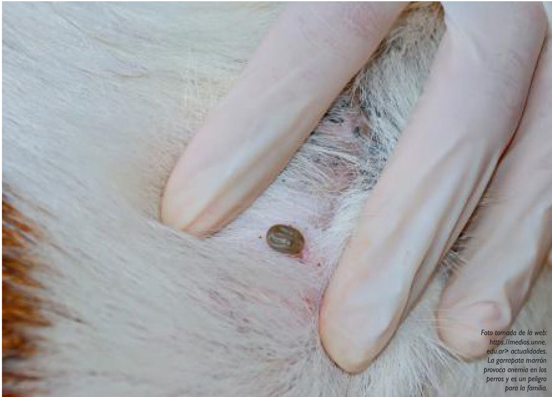
La garrapata marrón provoca anemia en los perros y es un peligro para la familia.