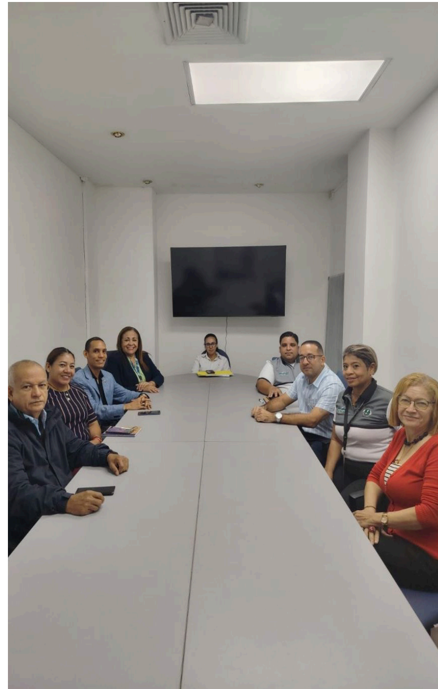
Mesa de Trabajo con personal de la Universidad de Panamá, Mi ambiente, Ministerio de Comercio e Industria y Autoridad de Turismo.

La iniciativa se desarrolló en conjunto con el Ministerio de Comercio e Industrias, la Autoridad de Turismo de Panamá y el Ministerio de Ambiente.