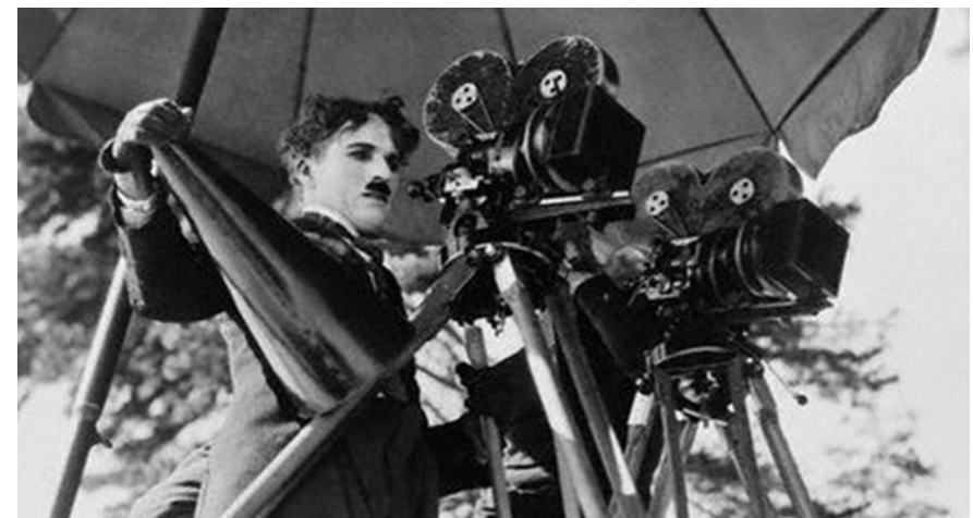
Charlie Chaplin el genio que revolucionó el séptimo arte.

Leonardo Sbaraglia ocupa un lugar cercano al que Antonio Banderas asumió en Dolor y gloria . Si Banderas era un alter ego físico del director, Sbaraglia se mueve en un territorio más emocional: el de un creador consciente de la fragilidad