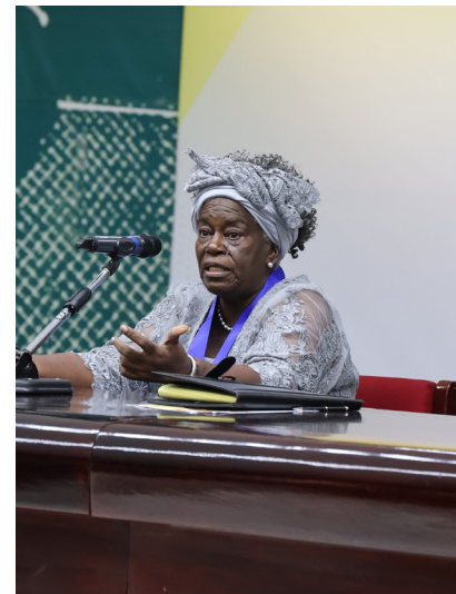
La Dra. Agatha desempeñó importantes cargos académicos y culturales.

A lo largo de su carrera, la historiadora ha sido conferencista nacional e internacional y ha impulsado iniciativas vinculadas con la etnohistoria, el género, la negritud y la lucha contra el racismo. Su labor le ha valido múltiples reconocimientos por su