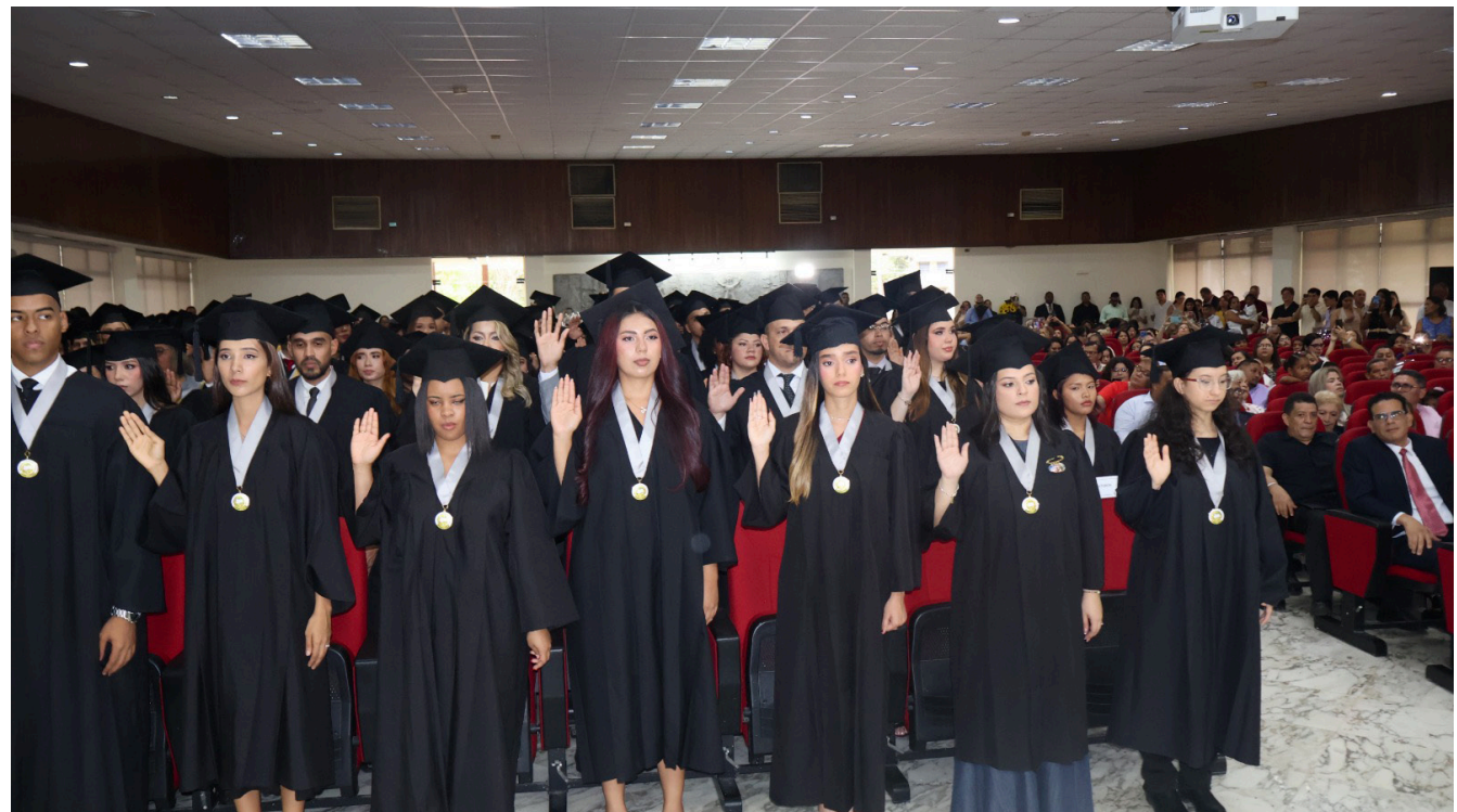
Promoción 2025 – 2026 Facultad de Comunicación Social.